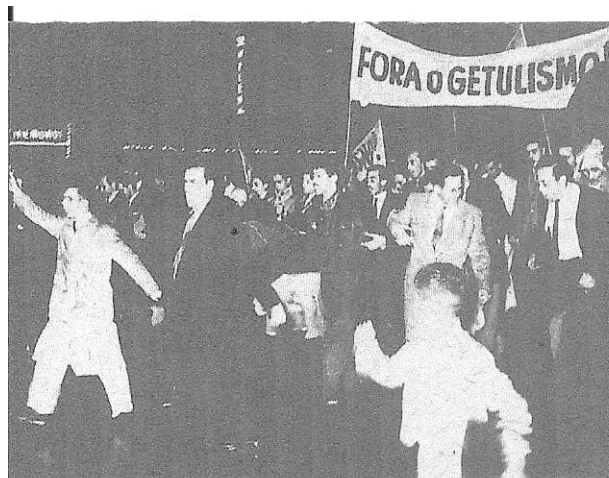
Foto de manifestação contra Getúlio Vargas em São Paulo, em março de 1945.

De acordo com o texto, a figura abaixo e o seu conhecimento, associe corretamente.