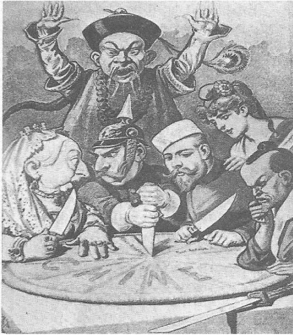
Dirigentes europeus discutindo a partilha da China.

24. A expansão imperialista do século XIX foi um novo passo no processo de mundialização da ordem capitalista. As populações africanas e asiáticas foram tragadas e incorporadas a uma ordem essencialmente europeia. Nesse contexto histórico, dadas as afirmativas seguinte,