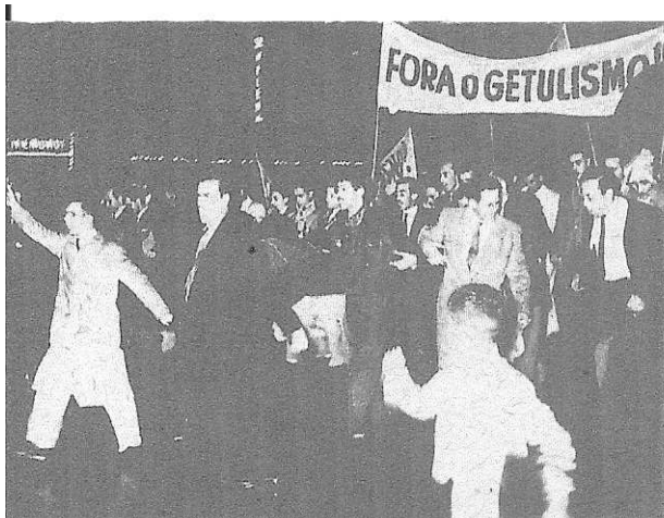
Foto de manifestação contra Getúlio Vargas em São Paulo, em março de 1945.

De acordo com o texto, a figura abaixo e o seu conhecimento, associe corretamente.