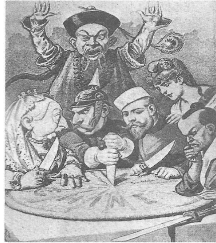
Dirigentes europeus discutindo a partilha da China.

20. A expansão imperialista do século XIX foi um novo passo no processo de mundialização da ordem capitalista. As populações africanas e asiáticas foram tragadas e incorporadas a uma ordem essencialmente europeia. Nesse contexto histórico, dadas as afirmativas seguinte,