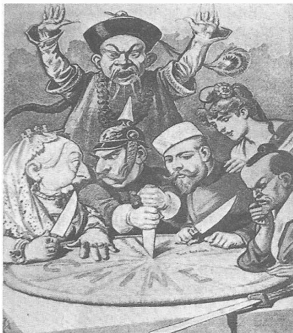
Dirigentes europeus discutindo a partilha da China.

24. A expansão imperialista do século XIX foi um novo passo no processo de mundialização da ordem capitalista. As populações africanas e asiáticas foram tragadas e incorporadas a uma ordem essencialmente europeia. Nesse contexto histórico, dadas as afirmativas seguinte,