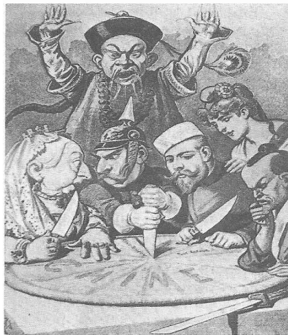
Dirigentes europeus discutindo a partilha da China.

20. A expansão imperialista do século XIX foi um novo passo no processo de mundialização da ordem capitalista. As populações africanas e asiáticas foram tragadas e incorporadas a uma ordem essencialmente europeia. Nesse contexto histórico, dadas as afirmativas seguinte,