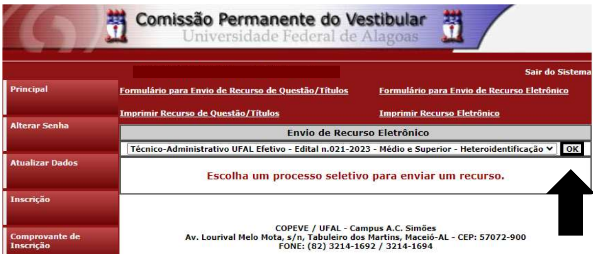
Figura 5 – Selecionar o certame.

6. Selecionar o Concurso Público “Técnico-Administrativo UFAL Efetivo – Edital n. 021-2023 – Médio e Superior – Heteroidentificação” e confirmar (Figura 5);