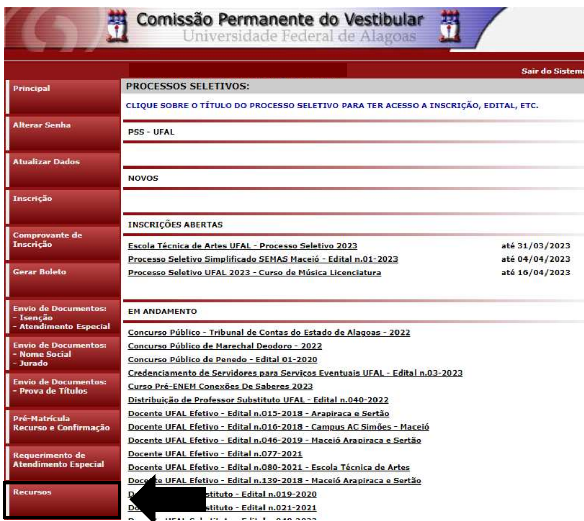
Figura 3 – Recursos