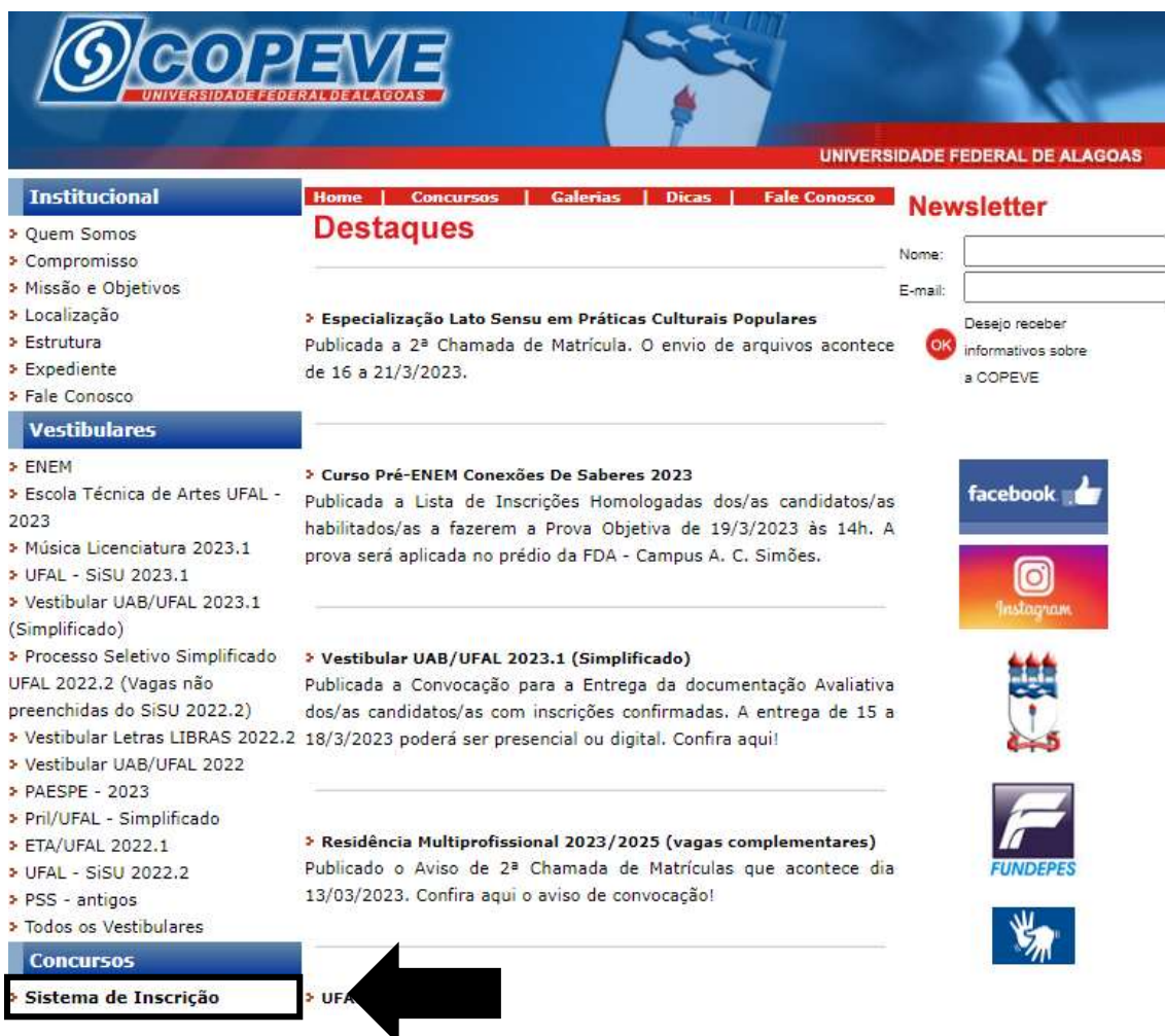
Figura 1 – Acessar Sistema de Inscrição