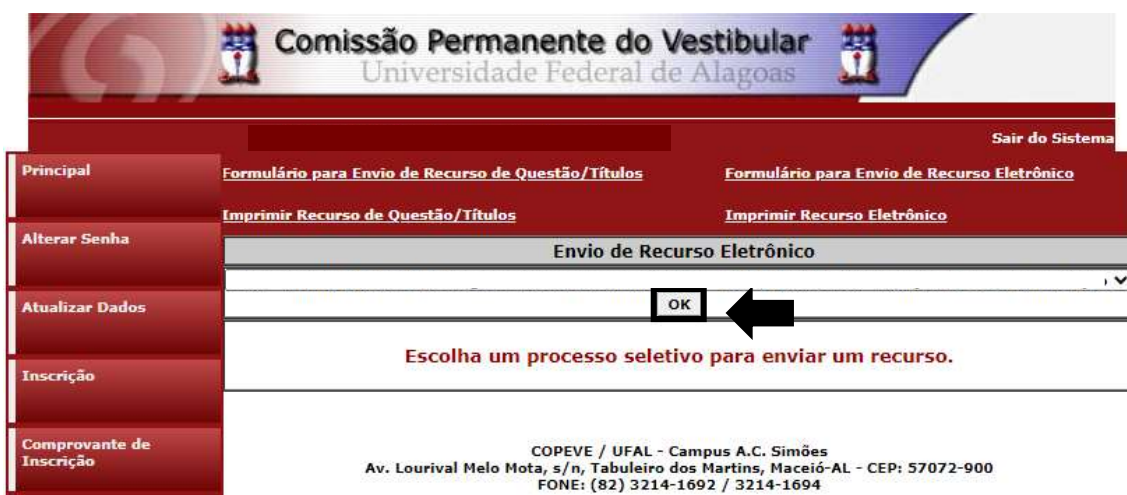
Figura 5 – Processo Seletivo Simplificado – SEMAS

6. Selecionar o “Processo Seletivo Simplificado SEMAS Maceió - Edital n.01-2023” – Isenção da taxa de inscrição” (Figura - 5);