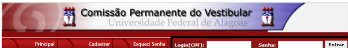
Figura 2 – Login e senha