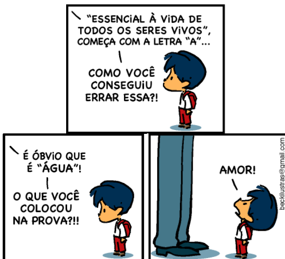
Disponível em: <http://opregadorpentecostal.blogspot.com.br/2014/08/noticias-gospel-neste-email-contem-40_29.html>. Acesso em: 29 set. 2015.

Quanto aos aspectos sintáticos presentes nos quadrinhos, assinale a alternativa correta.