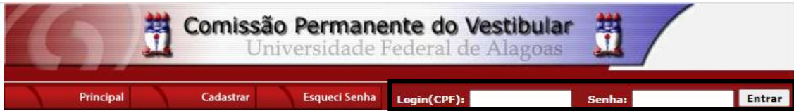
Figura 2 – Login e senha