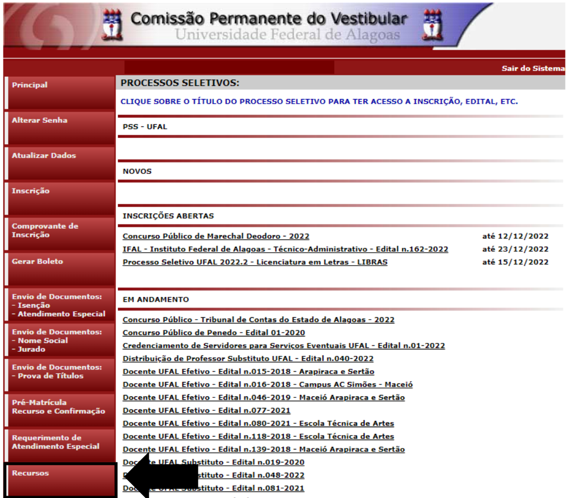
Figura 3 - Recursos