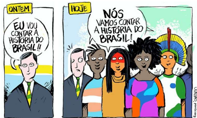
Disponível em: <http://www.juniao.com.br/chargecartum/ilustra_artigo_thiago_historia_unica_72/>. Acesso em: 24 fev. 2023.

Seguindo as orientações da Lei nº 10.639/2003, a crítica da charge enfatiza a necessidade de