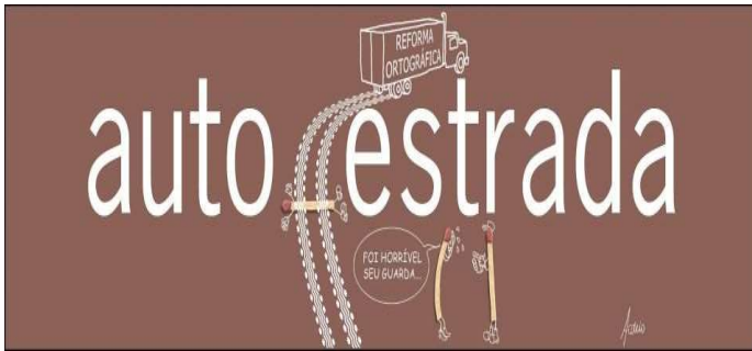
Disponível em: < https://educacao.uol.com.br/album/mobile/2015/10/01/a-reforma-ortografica-e-os-quadrinhos >. Acesso em: 3 fev. 2023.

Com relação à imagem e ao uso do hífen nas palavras formadas com prefixo, pode-se depreender que