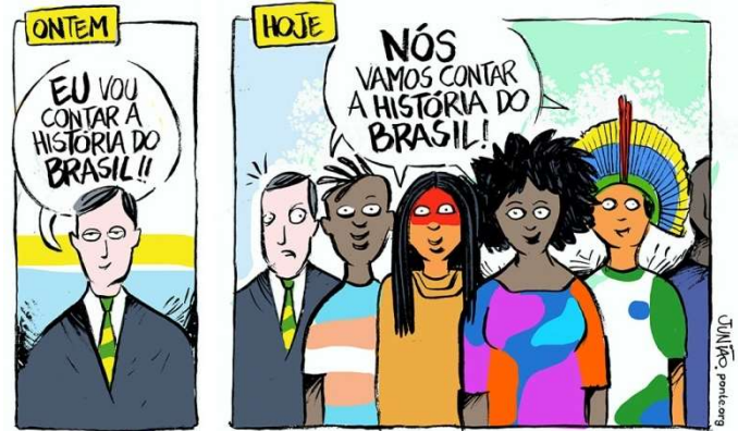
Disponível em: < http://www.juniao.com.br/chargecartum/ilustra_artigo_thiago_historia_unica_72/ >. Acesso em: 24 fev. 2023.

Seguindo as orientações da Lei nº 10.639/2003, a crítica da charge enfatiza a necessidade de